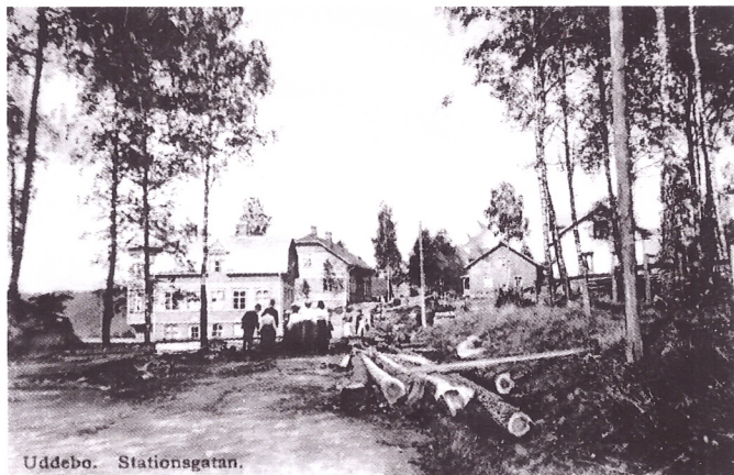
Uddebo. Stationsgatan. Stationsgatan (numera Kalsebovägen) i Uddebo.