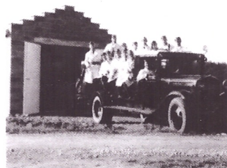
Brandstationen och dåtidens brandmän.